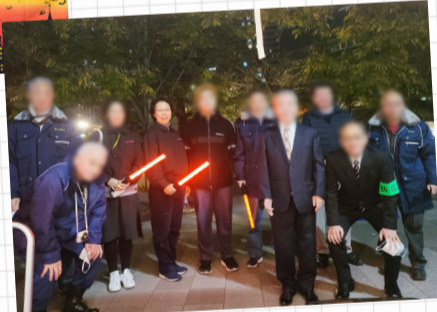
勝どき西町会 (年末特別 防災対策巡回)