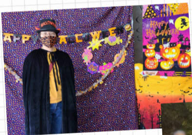
勝どき商栄会 (ハッピーハロウィン)