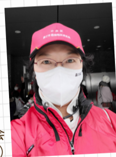
地区委員会 (東京探検)