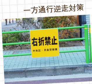
一方通行逆走対策