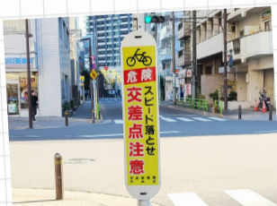
自転車飛び出し対策