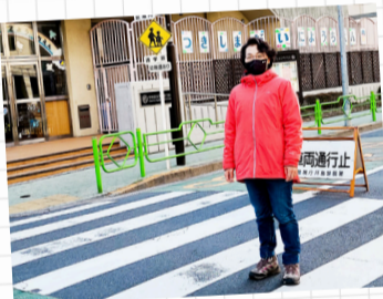
登校みまもり (月島第二幼稚園 角にて)